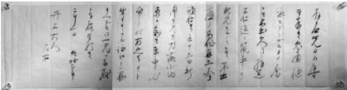
井上通泰宛森鷗外書簡(柳田國男・松岡家記念館蔵) 自分が詠んだ歌を見てほしいという内容が書かれています